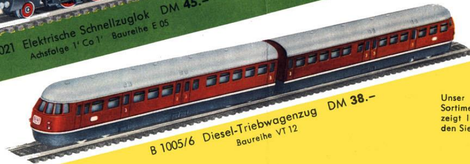
B 1005/6 Diesel-Triebwagenzug DM 38.- Baureihe VT 12