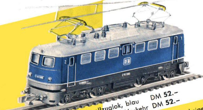
B 1025 Elektrische Schnellzuglok, blau B 1030 dto., grün, für gemischten Verkehr DM 52.- DM 52.-