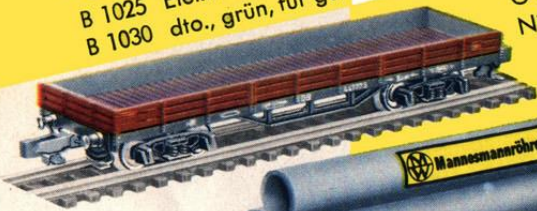
G 302 Vierachsiger Niederbordwagen mit Mannesmannröhren DM 6.25