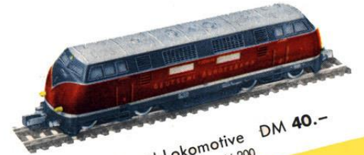
B 1014 Diesel-Lokomotive DM 40.- B'B', Baureihe V 200