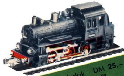
B 1011 C-Tenderlok DM 25.- Achsfolge C, Baureihe 89

im Maßstab 1:120 naturgetreu der großen Eisenbahn nachgebildet