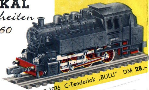
B 1026 C-Tenderlok „BULLI“ DM 28.-