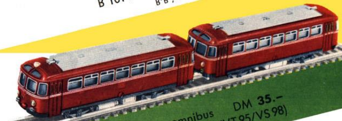
B 1022/23 Schienenomnibus DM 35.- mit Steuerwagen (VT 95/VS 98)