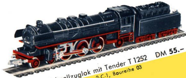
B 1004 Schnellzuglok mit Tender T 1252 DM 55.- Achsfolge 2-C-1, Baureihe 03