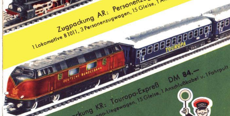
Zugpackung KR: Touropa-Expres DM 84.— 1 Diesel-Lokomotive, 2 Touropa-Liegewagen, 15 Gleise, 1 Anschlußkabel u. 1 Fahrpult