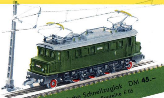
B 1021 Elektrische Schnellzuglok DM 45.- Achsfolge 1'Co1' Baureihe E 05