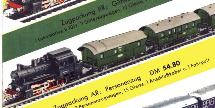
Zugpackung AR: Personenzug DM 54.80 1 Lokomotive B 1011, 3 Personenzugwagen, 15 Gleise, 1 Anschlußkabel u. 1 Fahrpult