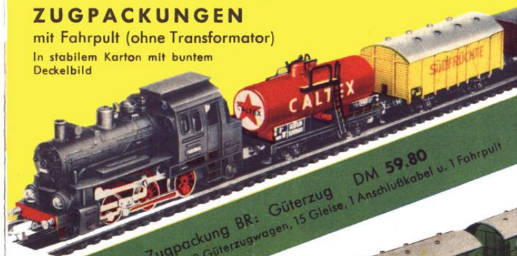
Zugpackung BR: Güterzug DM 59.80 1 Lokomotive B 1011, 3 Güterzugwagen, 15 Gleise, 1 Anschlußkabel u. 1 Fahrpult

In stabilem Karton mit buntem Deckelbild